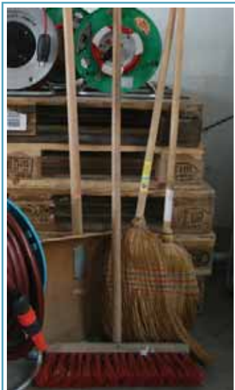
Die Reinigungsarbeiten nach dem Hochwasser sollten so rasch wie möglich durchgeführt werden. Geeignetes Werkzeug sollten Sie vorgesorgt haben.