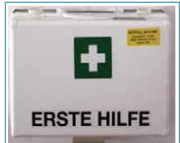
Die Hausapotheke sollte jährlich überprüft werden.

Material zum Verschließen von Gebäudeöffnungen Schalungsplatten (Doka-Platten), PU-Schaum (Montageschaum), Bausilikon, Pfosten, Latten, Staffeln und Profildichtungen dienen zum behelfsmäßigen Verschließen von Fenstern, Türen, Garagenabfahrten, Kellerabgängen etc. Achtung! Ist das Objekt von Wasser umgeben und steigt das Grundwasser über das Niveau der Gründungssohle, dann drückt das Wasser auf die Seitenwände und von unten auch auf den Kellerboden. Daher sind für solche Abdichtungsmaßnahmen eine ausreichende Standsicherheit aber auch eine entsprechende Gebäudelast Voraussetzungen dafür. Auch Wasserbeständigkeit und Wasserdichtheit der Außenwände und des Kellerbodens sind notwendig. Für geringe Wasserstände können auch Sandsäcke zum Einsatz kommen.