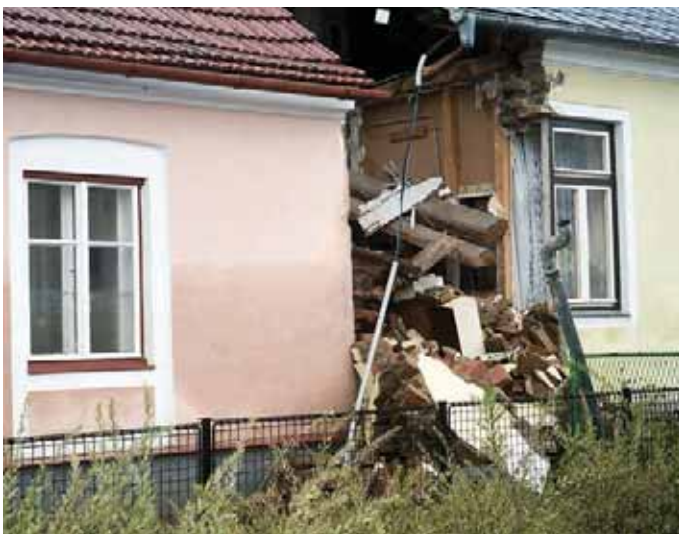
Gebäudeschaden durch Hochwassereinwirkung Hadersdorf am Kamp, Hochwasser 2002

Nach einer Katastrophe nehmen die Schadenskommissionen und Sachverständige der Versicherungen und Gemeinden ihre Arbeit unverzüglich auf. Sie besichtigen die Schäden. Wer nach dem