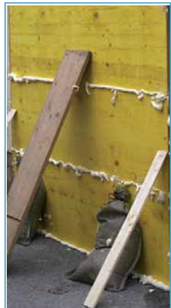
Behelfsmäßiger Gebäudeschutz mit PU-Schaum (Montageschaum) und Doka-Platten