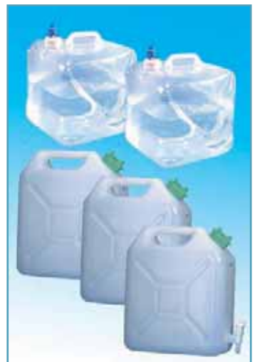
Ist bei Hochwasser mit einer Beeinträchtigung der Trinkwasserversorgung zu rechnen, sollte eine ausreichende Menge davon in geeigneten Behältern bevorratet werden. Da unbehandeltes Leitungswasser schon nach kurzer Zeit durch starke Vermehrung von Bakterien ungenießbar werden kann, sind geeignete Konservierungsmaßnahmen notwendig. Entsprechende Behälter sind z.B. im Campingfachhandel erhältlich.