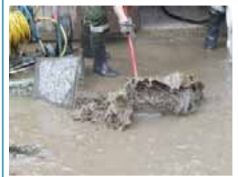
Ein Abzieher ist ein nützlicher Helfer bei den Reinigungsarbeiten.

Hautschutzcreme Eine gute Hautschutzcreme hilft für den Schutz der Haut, wenn man im Hochwasser arbeitet. Einen guten Schutz bieten vor allem jene Hautcremen, die einen Schutzfilm auf der Haut bilden. Durch die Verunreinigungen, die im Hochwasser immer gegeben sind, bilden schützende Cremes zum Teil einen antiallergenen Schutz und sind neben Handschuhen sehr zu empfehlen.