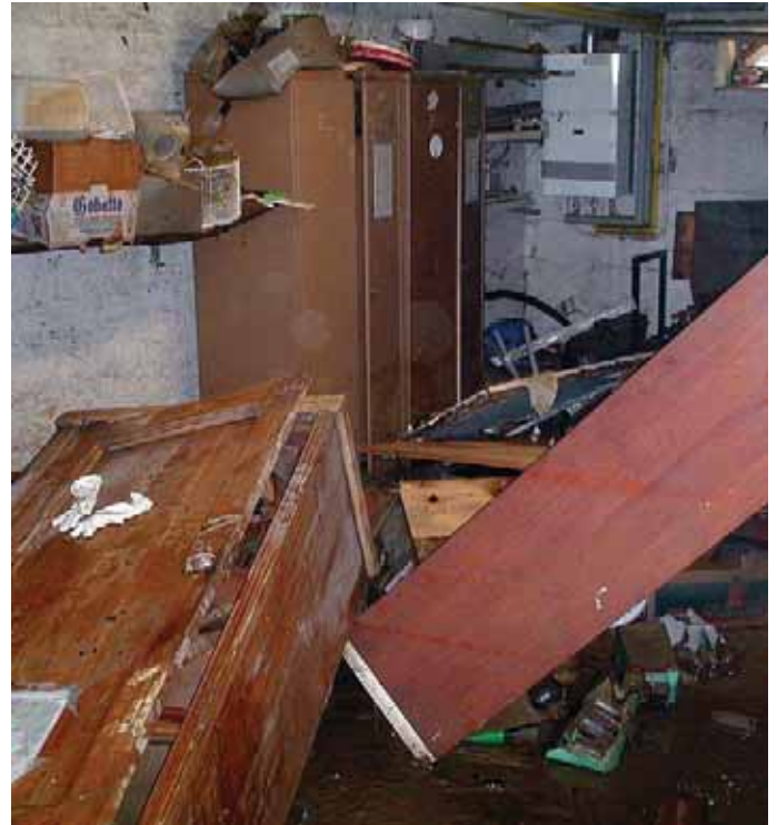
Keller nach dem Hochwasser 2002 in Hadersdorf-Kammern

Katastrophenereignis einen Schaden an seinem Eigentum feststellt, soll dies einerseits der Versicherung und andererseits der Gemeinde melden. Beide schicken dann Sachverständige aus, die den Fall begutachten.