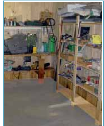
Gegenstände, die nicht nass werden dürfen, rechtzeitig aus dem Keller entfernen oder bei geringem Wassereinbruch zumindest hoch lagern.