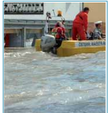
Die Haushaltsbevorratung ist eine der wichtigsten Selbstschutzmaßnahmen um im Katastrophenfall einige Tage ohne Einkaufsmöglichkeit zu überdauern. Tipps dazu sind bei uns erhältlich.

Wathose und Gummistiefel Wathose, auch Anglerhose genannt, ein Muss für jeden im Hochwasser! Oft muss man tiefer ins Wasser als einem lieb ist. Sparen Sie nicht am falschen Platz. Damit Sie sich in der Hose gut bewegen können, sollte sie aus weichem und nicht zu sprödem Material bestehen. Auch an Gummistiefel in ausreichender Anzahl mit eingebauter Stahlkappe und Wärmeschutz ist zu denken.