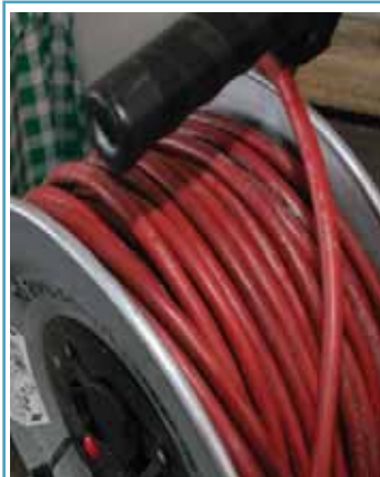
Oftmals ist die Stromversorgung unterbrochen. Sorgen Sie mit geeigneten Verlängerungskabel und Kabeltrommeln vor. Achten Sie auf Feuchtraumqualität.